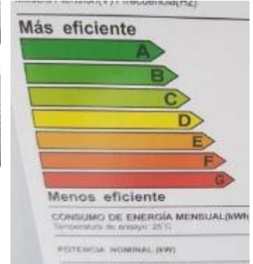
Calefones, refrigeradores y acondicionadores de aire Clase A