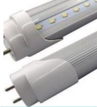
Lámparas y luminarias LED