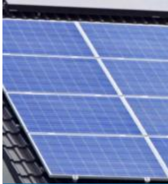
Paneles solares fotovoltaicos