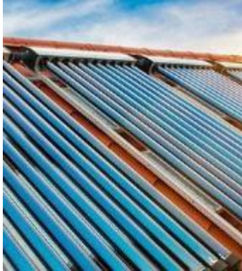
Paneles solares térmicos