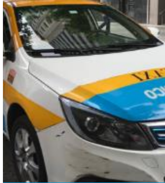
Vehículos livianos eléctricos empadronados