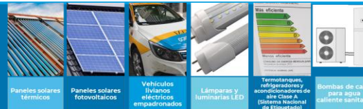
Paneles solares térmicos